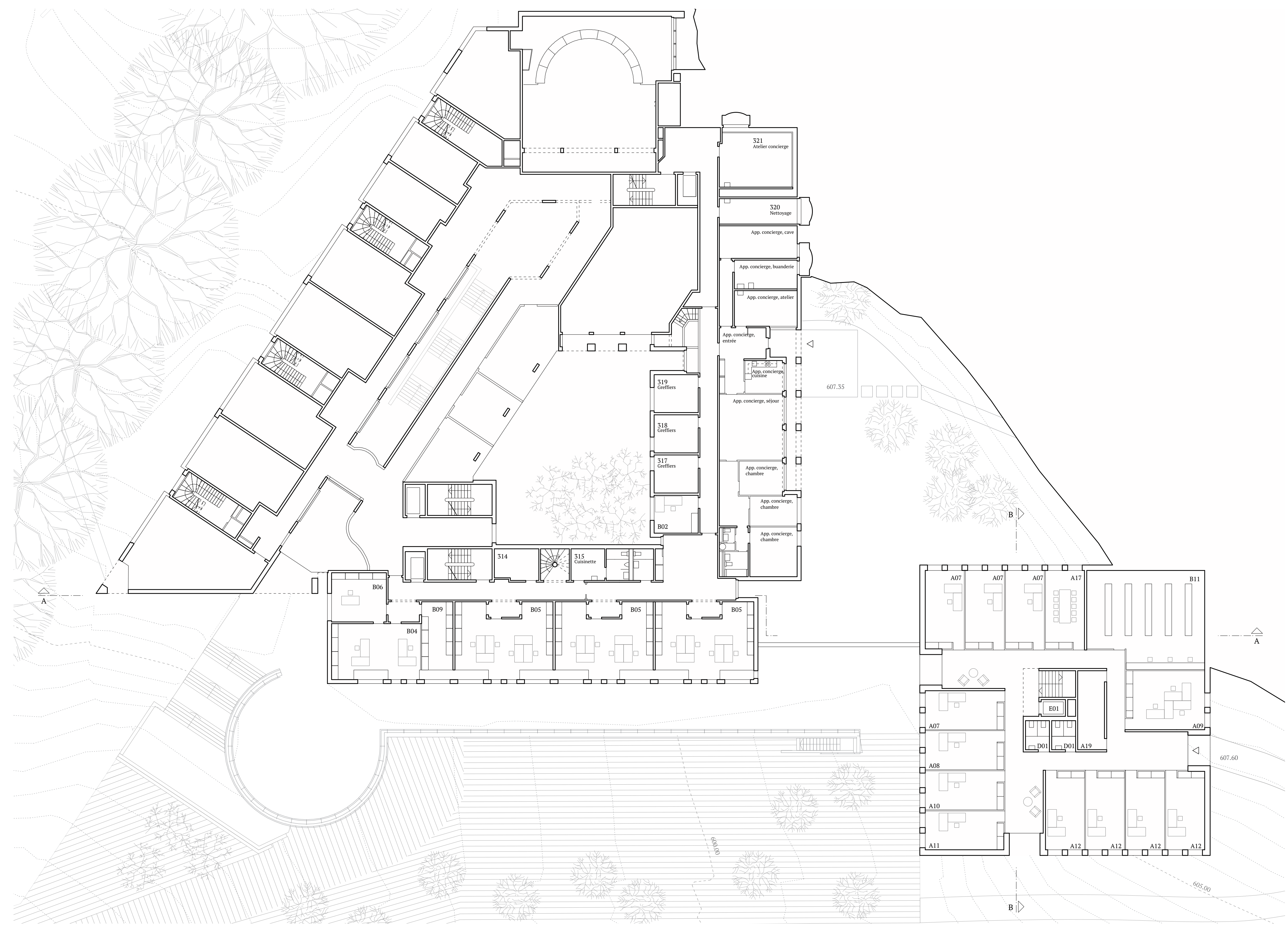
Niveau 03 _ 607.60 : A SG - OJV. Ech 1/200